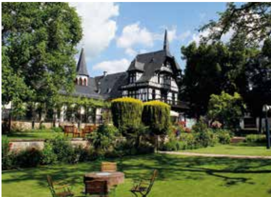
Das ehemalige Wohnhaus des Baronett Sutton, erbaut im englischen Landhausstil, ist heute der Sitz des bekannten Weinguts R. Weil

Weinlagen zwischen Wiesental und Burg Scharfenstein sich „vor Ort“ die guten Tropfen schmecken zu lassen, die dort gewachsen sind. Das älteste Weinfest in Kiedrich, das Rieslingfest, feiert man nun schon seit einigen Jahren auf dem neuen Josef-Staab-Platz zwischen Rathaus und Sonnenlandstraße.