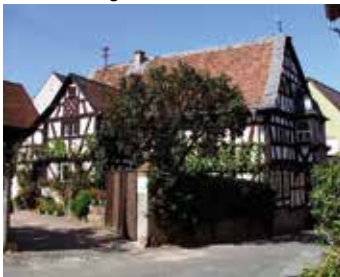
Erbaut auf den Grundmauern einer fränkischen Schmiede, das markante Fachwerkhaus „Alte Schmiede“ in Kiedrich

Sehenswert sind auch die alten Bürger- und Adelshöfe und die vielen Fachwerkhäuser im alten Ortskern. Ganz besondere Ausichten eröffnet die mitten in den Weinbergen gelegene Burgruine Scharfenstein.