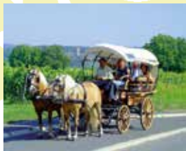
Ob auf Schusters Rappen oder mit zwei PS und dem Planwagen, erkunden Sie Kiedrich, die Weinberge und die Wälder des Taunus.

Für Wanderer und Naherholungssuchende ist Kiedrich ein kleines Paradies. Wald und Weinberge rund um Kiedrich laden zu erholsamen und interessanten Spaziergängen ein.