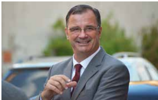
Bürgermeister Winfried Steinmacher